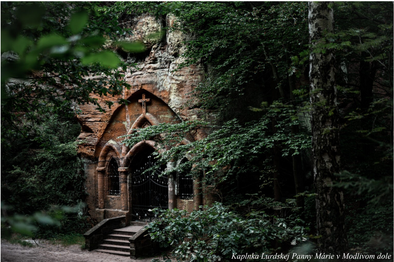
Kaplnka Lurdskej Panny Márie v Modlivom dole