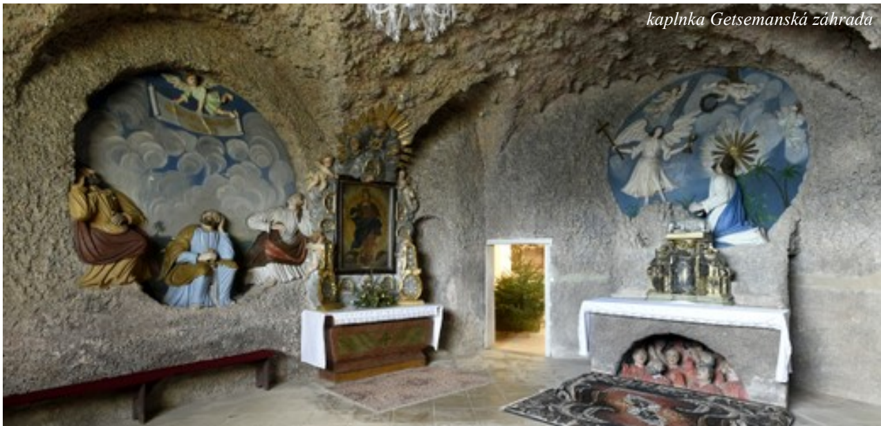
kaplnka Getsemanská záhrada