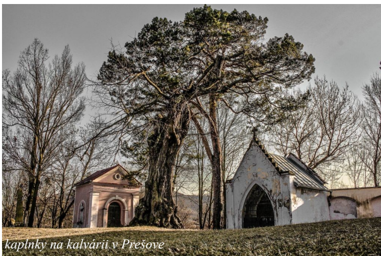
kaplnky na kalvárii v Prešove