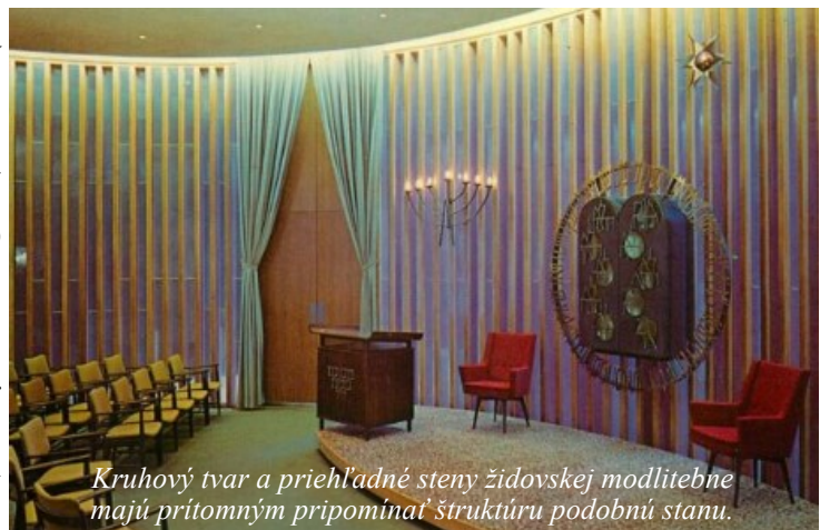
Kruhový tvar a priehľadné steny židovskej modlitebne majú prítomným pripomínať štruktúru podobnú stanu.