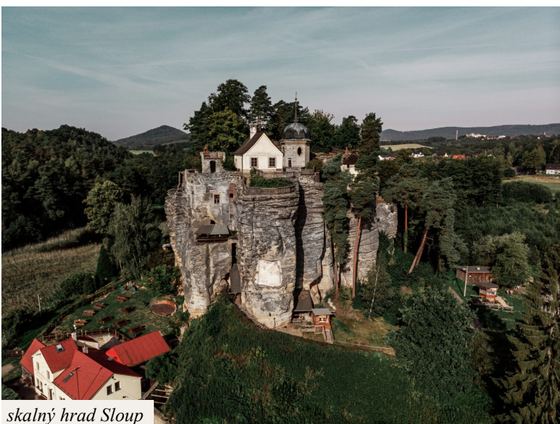
skalný hrad Sloup

kraj opäť postihla epidémia prišli sem pútnici až z Českej Lípy. Mnohí sa tu modlili za uzdravenie a boli vypočutí. Cirkevné úrady zmenili svoj pohľad na miesto modlitby koncom 19.st. Vďaka podpore grófkyn Alžbety Kinskej bol v r. 1903 interiér kaplnky upravený na spôsob Lurdskej jaskyne a kaplnka bola oficiálne zasvätená Panne Márii Lurdskej. Prichádzali sem procesie zo širokého okolia a zastavil sa tu aj cisár Ferdinand V. pri svojich prechádzkach z neďalekého zámku v Zákupoch. Počas vojen v 20.st pútnické miesto upadlo do zabudnutia. Po r. 1945 bolo zdevastované, 70.rokoch bola odstránená aj krížová cesta, v 90.rokoch bola z kaplnky ukradnutá aj socha Panny Márie. Svojej obnovy sa kaplnka dočkala až pred pár rokmi. Prebehli opravy, výstavba novej krížovej cesty a v r. 2016 bolo pútnické miesto opäť slávnostne otvorené. Sv. omša sa tu koná vždy 1.mája o 15,00 hod. Biskup z Litomeřickej diecézy takto pravidelne každoročne otvára mesiac mariánskej úcty. Na ceste ku kaplnke možno nájsť veľa krásnych zákutí. Blízko je aj zrúcanina hradu s inou skalnou kaplnkou a s drevenou zvonnicou. Dostať sa sem dá z autobusovej zastávky Svojkov (pri zámku), kde sa dá aj pohodlne zaparkovať. Odtiaľ vedie nenáročná lesná krížová cesta. Občerstvenie ponúka aj studnička, ktorá nesie názov Prameň pri