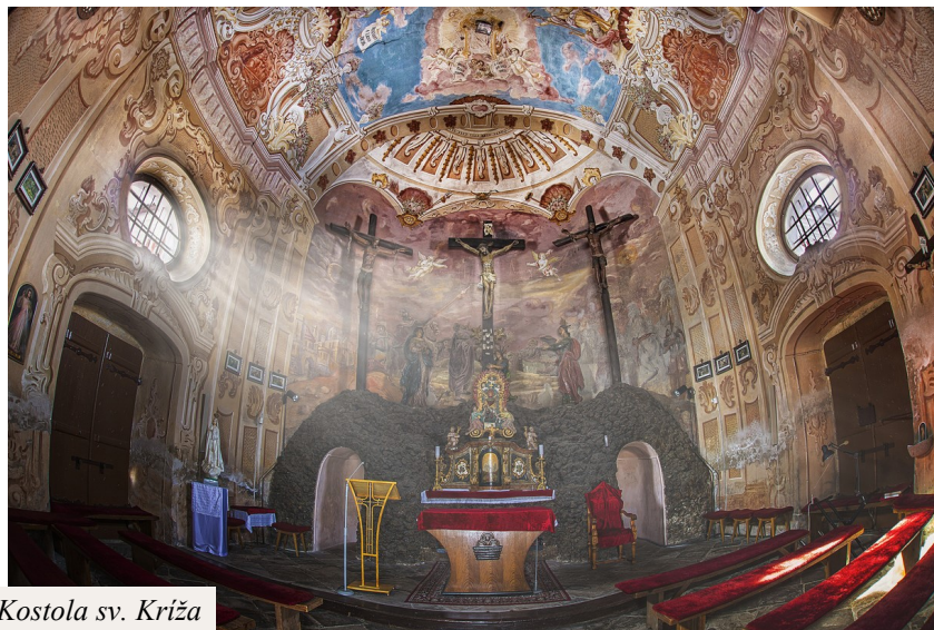
exteriér a interiér Kostola sv. Kríža

zdroje: www.kalvariejaromerice.cz , www.poutni.ado.cz , www.kudyznudy.cz , www.region.rozhlas.cz , www.tyden.cz , www.ceskatelevize.cz , www.pamiatkynaslovensku.sk , www.oscadnica.fara.sk , www.saletinirozkvet.webnode.sk , www.blog.sme.sk/simunekova/ , www.regionkysuce.sk , www.gopresov.sk , www.sk.wikipedia.org , www.vypadni.sk , www.severovychod.sk/presov/zoznam.sk