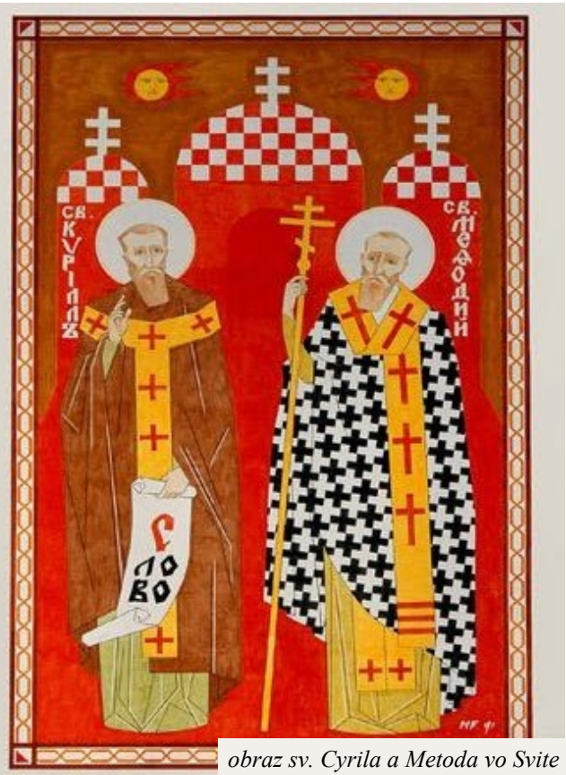
obraz sv. Cyrila a Metoda vo Svite

Pod Tatrami, v okrese Poprad, nájdeme až tri kostoly zasvätené svätým vierozvestom. Dva z nich sú v meste Svit , v jednom z najmladších miest na Slovensku, ktoré leží iba 7 km od Popradu. Toto priemyselné mesto „vyrástlo“ až po 2. svet. vojne zásluhou podnikateľa Tomáša Baťa. Už pri výstavbe továrne na umelý hodváb a domova pre jej zamestnancov mal Baťa v úmysle postaviť aj kostol. To sa však podarilo až po páde komunizmu. V r. 1991 bol vo Svite posvätený prvý chrám postavený na Slovensku po „nežnej revolúcii“. Ten bol zasvätený sv. Jozefovi. V kaplnke, umiestnenej v južnej časti chrámu sa po jeho dokončení konali slávenia svätých liturgií gréckokatolíckeho obradu. Časom kaplnku gréckokatolíkom prenechali a táto kaplnka bola povýšená na gréckokatolícky chrám sv. Cyrila a Metoda. A tak sú pod jednou strechou oba chrámy: rímskokatolícky chrám sv. Jozefa, robotníka a gréckokatolícky chrám sv. Cyrila a Metoda. Od r. 2010 má gréckokatolícka farnosť vo Svite svojho vlastného správcu a od r. 2015 aj vlastnú farskú budovu. Popri rieke Poprad, ulicami mestečka sa dá prejsť až k žel.stanici, kde začína zelená turistická