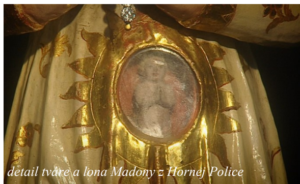
detail tváre a lona Madony z Hornej Police