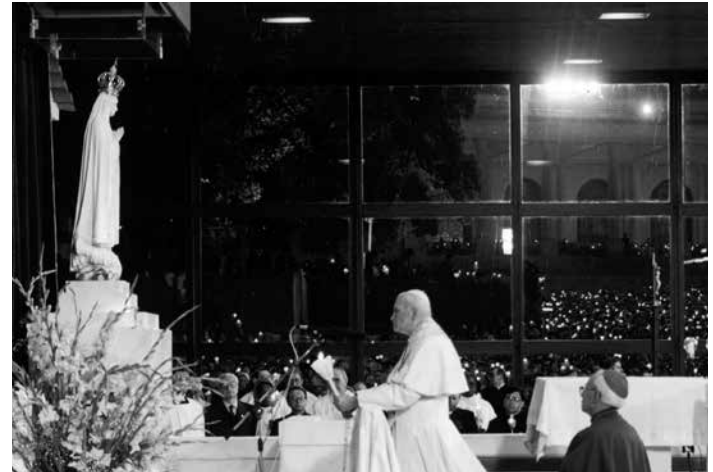
Pápež sv. Ján Pavol II. sa modlí ruženec pri milostivej soche Panny Márie vo Fatime 13. mája 1991.

„Cirkev prijala fatimské posolstvo predovšetkým preto, lebo obsahuje takú pravdu a výzvu, ktoré sú svojím podstatným obsahom náplňou samotného evanjelia.“