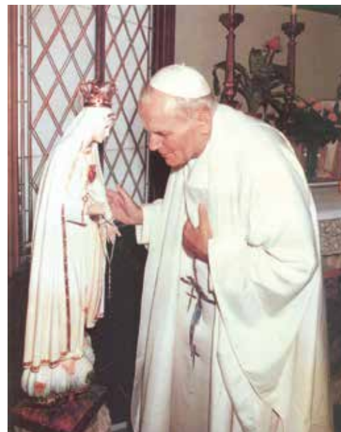
Pápež sv. Ján Pavol II. si uctieva milostivú sochu Panny Márie z Fatimy.

„Slovensko má veľkú úlohu pri budovaní Európy tretieho tisícročia. Dobre si to uvedomte! Povolané je ponúknuť svoj veľmi významný príspevok k pravému pokroku európskeho kontinentu svojimi tradíciami, kultúrou, svojimi mučeníkmi a vyznávačmi, ako aj živými silami svojich nových generácií.“