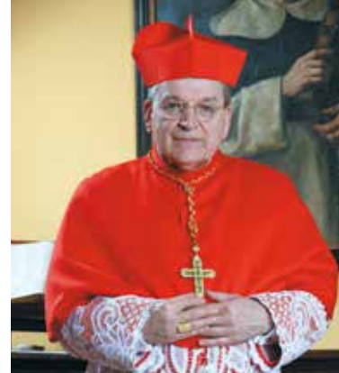
Kardinál Raymond Leo Burke

Posledné slová panskej Matky Vykupiteľa, zaznamenané v evanjeliách, sú slová obsluhujúcim na svadbe v Káne, ktorí k nej prišli s úzkosťou, lebo novomanželia nemali dostatok vína pre hostí. Na stav ich veľkej núdze zareagovala tým, že ich nasmerovala na svojho Syna, ktorý bol tiež hosťom na svadobnej hostine, a poradila im: „ Urobte všetko, čo vám povie. “ 1 Tieto jednoduché slová vyjadrujú tajomstvo božského materstva, ktorým sa Panna Mária stala Matkou Boha. Tým, že priniesla na svet vteleného Božieho Syna, pokračuje v sprostredkovaní všetkých tých milostí, ktoré nezmerne a neprestajne prúdia zo slávneho prebodnutého Božského Srdca jej Syna do srdc jeho verných synov a dcér putujúcich na zemi k svojmu večnému domovu v nebi.