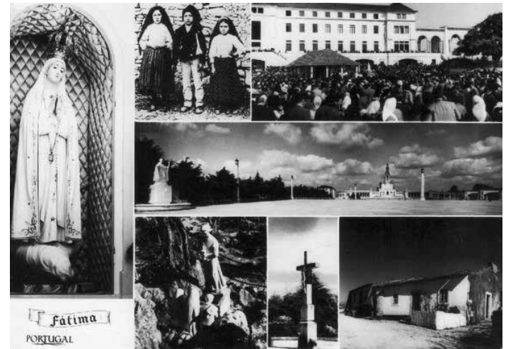
Historická pohľadnica z Fatimy

„Nemožno hovoriť o 20. storočí bez nevyhnutného spomenutia Fatimy.“