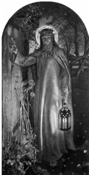
Kristus, Svetlo sveta

Svätá Panna odhaľuje základy katolíckej viery, ktoré svojimi zjaveniami vo Fatime nanovo oprašuje pred „moderným“ človekom a predkladá nám ich ako jediné riešenie súčasných problémov.