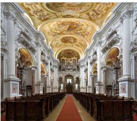
interiér kláštorného chrámu St.Florian