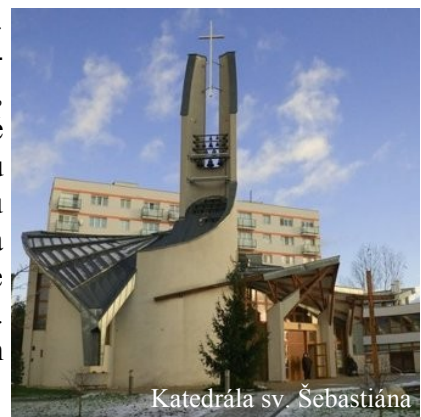
Katedrála sv. Šebastiána