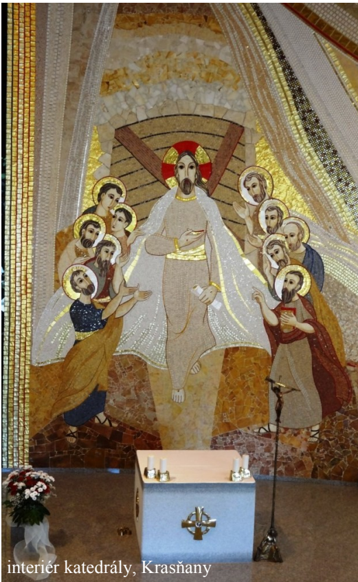
interiér katedrály, Kráshany

Po vstupe do chrámu uchváti prichádzajúcich veľkolepá mozaika, ktorú v r. 2011 v spolupráci so skupinou umelcov z rímskeho centra Centro Aletti vytvoril svetoznámy umelec slovinského pôvodu Marko Ivan Rupnik SJ . Monumentálne dielo má 150 m 2 . Vytvorili a premodlili ho pätnásť umelci rôznych vierovyznaní a národností. Boli medzi nimi laici, rehoľné sestry aj štyria kňazi. Rupnik sa považuje za žiaka a nasledovníka českého kardinála To-máša Špidlíka.