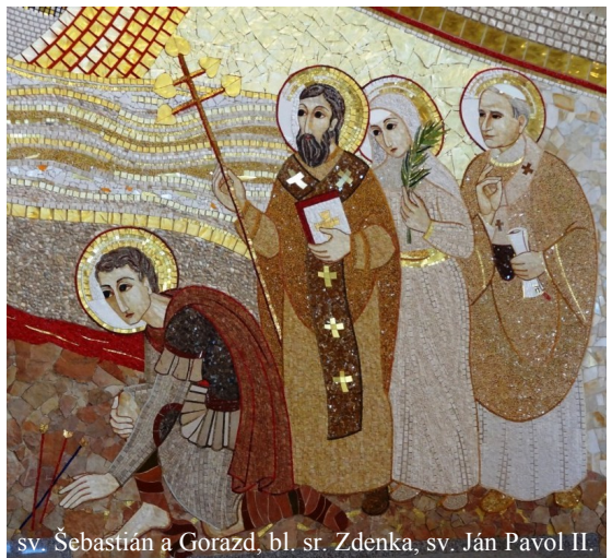
sv. Šebastián a Gorazd, bl. sr. Zdenka, sv. Ján Pavol II.

bl. sestra Zdenka Schelingová a sv. Ján Pavol II. V katedrále si pútnici môžu uctiť relikvie patróna ordinariátu - sv. Šebastiána, sr. Zdenky aj slovanského pápeža. Okrem hlavného patróna sú nebeskými orodovníkmi tejto diecézy aj svätí vojaci a mučeníci Florián a Juraj, sv. vojak a biskup – Martin z Tour a tiež nebeský bojovník sv. Michal Archanjel. Sú všeobecne dobre známi, ich sochy, obrazy či fresky sa nachádzajú v mnohých našich kostoloch, mestečkách i dedinách. Takto si na celom území SR môžeme pripomenúť pôsobenie slovanského vojenského ordinariátu a spočinúť v modlitbe či putovaní za pokoj a mier vo svete. Hlavného patróna sv. Šebastiána, ktorého sviatok slávime 20.januára, sme predstavili už v Pútnickom liste 01/2019, a tak dáme priestor inému vojakovi - sv. Floriánovi, ktorého mnohí z nás poznajú „len“ ako patróna hasičov.