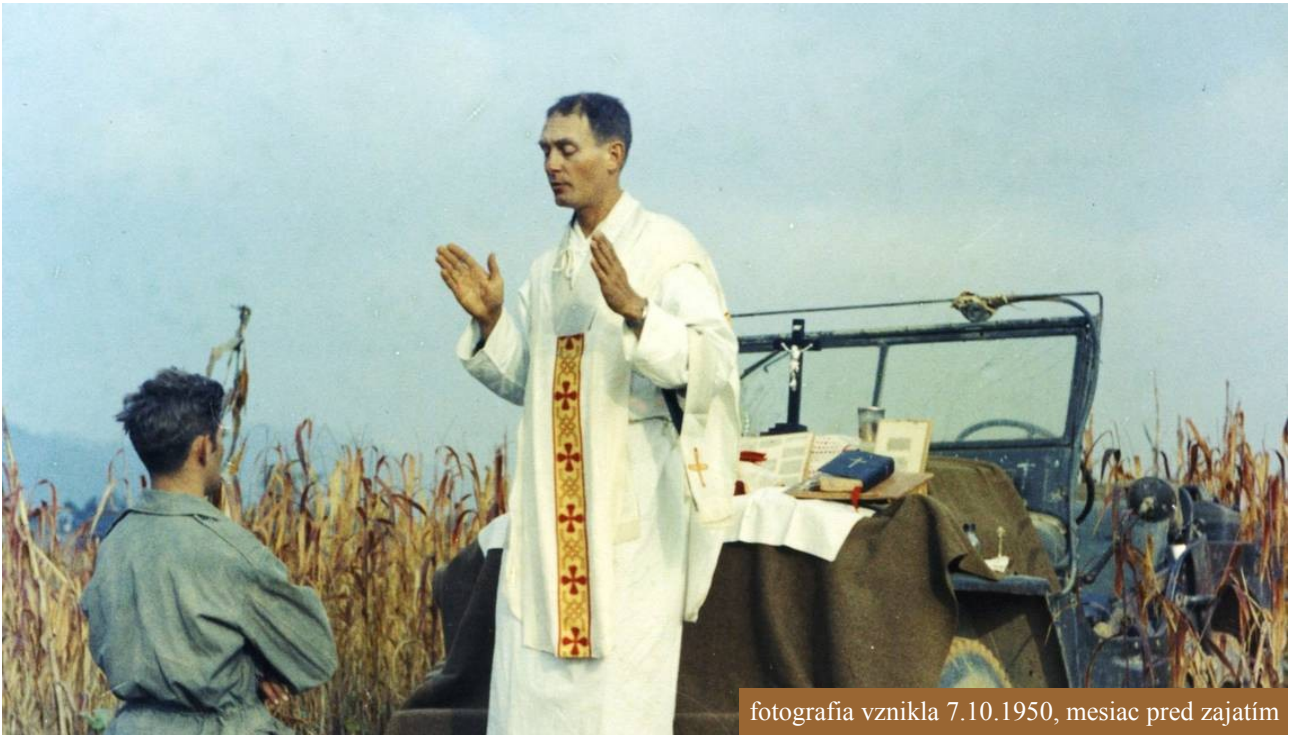
fotografia vznikla 7.10.1950, mesiac pred zajatím

Stav 35ročného kaplána sa za 6 týždňov tajnej starostlivosti začal zlepšovať, avšak všetko ukončila razia dozorcov, pri ktorej zobrali do domu smrti aj ťažko chorého kaplána Kapauna. Na smrť odsúdený kňaz aj v tomto momente odvážne posilňoval ostatných, Svoj misál odovzdal dôstojníkovi a žiadal ho, aby pokračoval v spoločných modlitbách. Povzbudzoval iných, aby po návrate domov žili čestne a zodpovedne a upokojoval všetkých, aby za ním neplakali. Svojím postojom ukázal svoju nezlomnú vieru v nebo a v Ježiša Krista. Zajatí muži sa odvážne postavili pred dozorcov a vyhlásili, že nosidlá s otcom Emilom Kapaunom vynesú hore na kopec sami. V Dome smrti prežil otec Emil Kapaun dva dni. Pochovali ho hromadného hrobu.