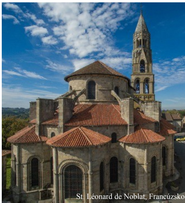
St. Léonard de Noblat, Francúzsko