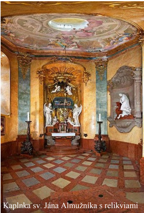
Kaplnka sv. Jána Almužníka s relikviami

Relikvie sv. Jána Almužníka boli podľa tradície darom tureckého sultána Bajazida II. kráľovi Matejovi Korvínovi v r.1489 a boli uložené v kráľovskej kaplnke v Budíne. V r.1526 po porážke uhorských vojsk pri Moháči boli v kráľovskom sprievode Márie Habsburskej, spolu s inými cennosťami a kráľovským pokladom, prevezené do Bratislavy a uložené na Hrade. Tu ostali až do 5. júna 1530, keď boli na príkaz Ferdinanda I. prevezené do Dómu svätého Martina, kde mali byť uložené až do čias, kedy sa budú môcť vrátiť na pôvodné miesto do Budína. V bratislavskom farskom chráme ich najprv uložili v sakristii, kde odpočívali vyše sto rokov. Slávnostné uloženie svätcových ostatkov do samostatnej kaplnky sa konalo 28. októbra 1732. (viac o jeho živote nájdete v PL č. 1/2019, www.putnickemiesta.sk )