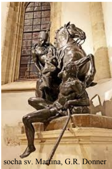
socha sv. Martina, G.R. Donner

Patrónom Bratislavskej arcidiecézy sa stal, na tomto mieste už rokmi uctievaný,