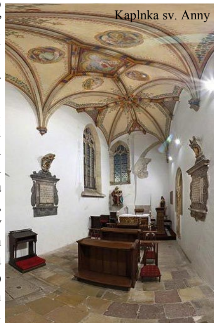
Kaplnka sv. Anny

sv. Martin z Tours, biskup a jeho nádhernú sochu odliatu z olova, ktorú zhotovil Georg Rafael Donner, môžete obdivovať v pravej lodi Dómu sv. Martina , ktorý bol slávnostne posvätený 10.marca 1452. Je najzachovalejším a najväčším gotickým kostolom v Bratislave. S jeho stavbou sa začalo začiatkom 14. st. a podieľali sa na nej známi stavitelia pracujúci na Dóme sv. Štefana vo Viedni – Hans Puchsbaum a neskôr Anton Pilgram Najskôr bolo postavené presbytérium a potom trojlodie. Nový kostol mal byť pôvodne bazilikou (s najvyššou strednou loďou), neskôr sa rozhodli pre halovú (sieňovú) stavbu s rovnakou výškou lodí. Zaujímavosťou je takmer nepozorovateľná asymetria, pravdepodobne zámerná, prevzatá z gotických stavieb južného Nemecka. Chrámová loď znázorňuje Kristovo telo na kríži a presbytérium sklon jeho hlavy. Definitívnym završením stredovekého vývinu Dómu bola prístavba nevelkej neskorogotickej predsiene pristavaná k južnému portálu okolo r.1510. Od 15. – 18.st. prešiel chrám viacerými premenami - prestavbami či prístavbami. Do r.1551 pristavili v neskorogotickom slohu Kaplnku sv. Anny . V r.1732 na severnej strane chrámu