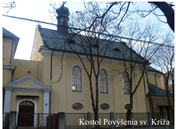
Kostol Povýšenia sv. Kríža

zdroj: Dejiny Kongregácie milosrdných sestier Sv. kríža a jej zakladatelia, Stručné dejiny kostola Povýšenia Sv. Kríža, internet fotografie: www.zdenka.sk