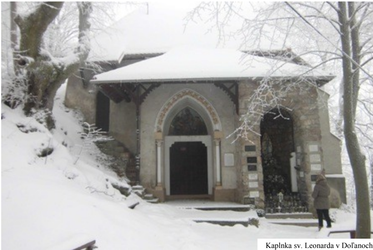
Kaplnka sv. Leonarda v Dol'anoch

Sv. Leonard bol francúzskym vojakom a neskôr pustovníkom. Na Slovensku, ak sa nemýlim, máme len jedno jediné miesto, kde si ho uctieваме. Ako sa vlastne dostal francúzsky svätec -sv. Leonard - do Dolian?