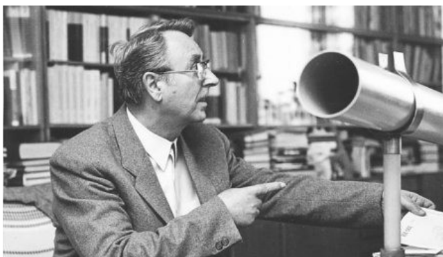
Mons. Ján Chryzostom Korec, 27-ročný tajne vysvätený biskup, v r.1960 - 1968 politický väzeň, v r.1968 - 1984 robotník v Bratislave.