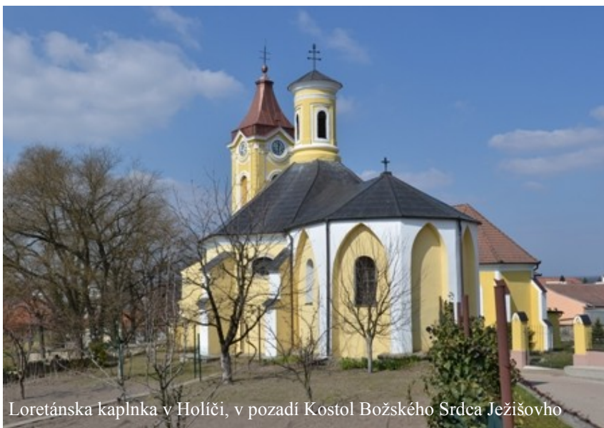
Loretánska kaplnka v Holíči, v pozadí Kostol Božského Srdca Ježišovo

V Holíči sa blízko kostola Božského Srdca Ježišovo nachádza na pohľad baroková kaplnka Loretskej Panny Márie, ktorá však v sebe ukrýva bohatú minulosť stredoveku. Kaplnka vznikla ako románsky kostolík, ktorý dal pravdepodobne i názov tomuto zaujímavému mestečku na Záhorí. Holíč sa v dobových prameňoch (r.1315) spomína ako Alba Ecclesia, Weisskirchen, čiže Biely kostol. Išlo o nevelikú dvojpodlažnú ranogotickú stavbu na pôdoryse 6-uholníka s pozdĺžnou loďou a polygonál-