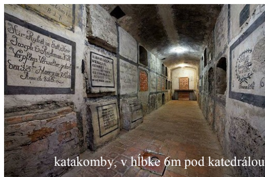
katakomby, v hĺbke 6m pod katedrálou

príbudla baroková Kaplnka sv. Jána Almužníka , ktorá patrí k umelecky najhodnotnejším pamiatkam v Bratislave. O jej výstavbu sa zaslúžil arcibiskup Esterházy, jeden z najväčších donorov tohto chrámu. Kaplnka sa stala dôstojným miestom uloženia svätcových ostatkov a súčasne mala byť arcibiskupovou pohrebnou kaplnkou, krypta sa nachádza pod kaplnkou. Okrem arcibiskupa sú v katakombách katedrály pochovaní aj významní šľachtici, cirkevní hodnostári a umelci, napr. bratislavský kanonik a autor prvého slovenského románu Jozef Ignác Bajza. História chrámu sa doráža aj na veži kostola (z r.1847), ktorá je vysoká 85m a na jej vrchole je umiestnená kópia svätoštefanskej koruny , symbolizujúca korunovačný chrám. Predchádzajúce veže boli zničené bleskom (v r.1760) a požiarom (v r.1835). Počas posledných reštaurátorských prác v r. 2010 našli v korune jedinečný pergamen z r.1765.