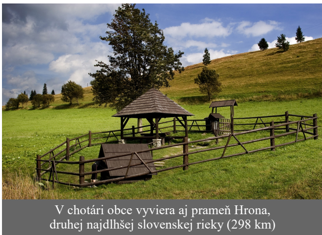
V chotári obce vyviera aj prameň Hrona, druhej najdlhšej slovenskej riekky (298 km)

V dobe 2. svet. vojny Nemci obec 5.9.1944 vypálili. Zhorelo vtedy 263 domov. Od r. 1995 sa v Telgárte organizuje festival Ozveny staroslovienčiny pod Kráľovou hoľou , ktorý sa snaží prezentovať východnú liturgiu a charakteristický chrámový a ľudový viachlasný spev. Festival začína občerstvením pri prameni Hrona. Je priamo spojený s Kráľovou hoľou, kde sa presne na poludnie, z najvyššej skaly ozve hymnická pieseň „Na Kráľovej holi“. Ide o jedinečný kultúrny zážitok umocnený pohľadom na Vysoké Tatry. Na festivale participuje aj gréckokatolícka cirkev. (pokračovanie na str. 6)