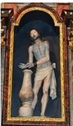
v južnej kaplnke je oltár Muža bolesti z obdobia okolo r. 1700