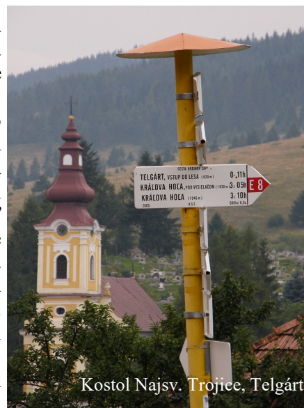
Kostol Najsv. Trojice, Telgárt