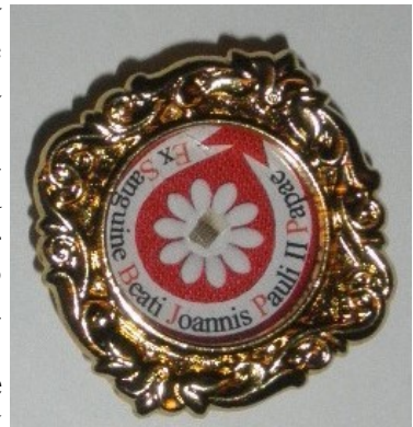
relikvia krvi sv. Jána Pavla II.