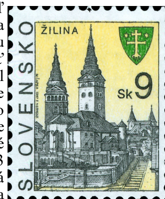
Pohľad na obe veže z Námestia Andreja Hlinku je jedným zo symbolov Žiliny. Veľmi často sa objavuje na pohľadniciach, na rôznych publikáciách i na poštovej známke z r. 1997.