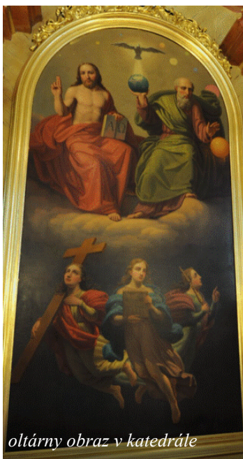
oltárny obraz v katedrále