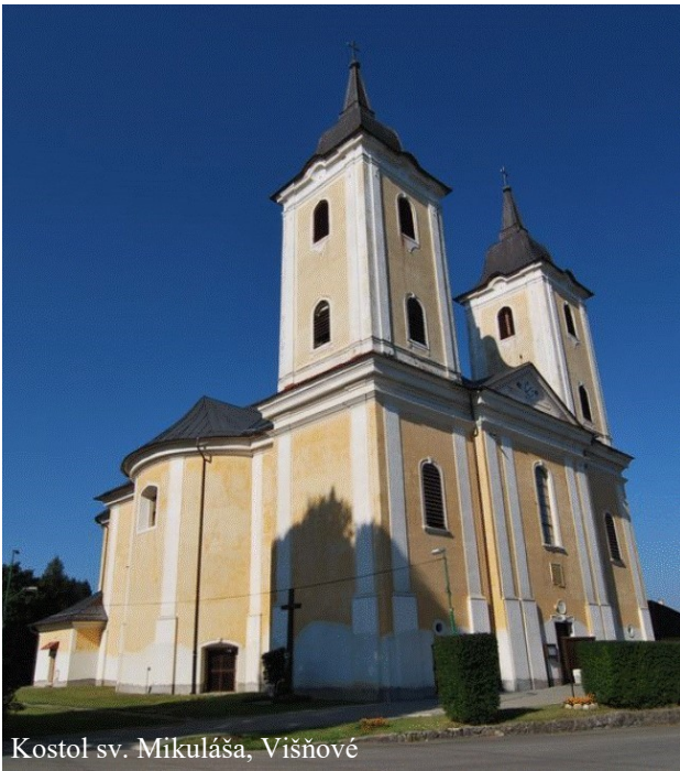
Kostol sv. Mikuláša, Višňové