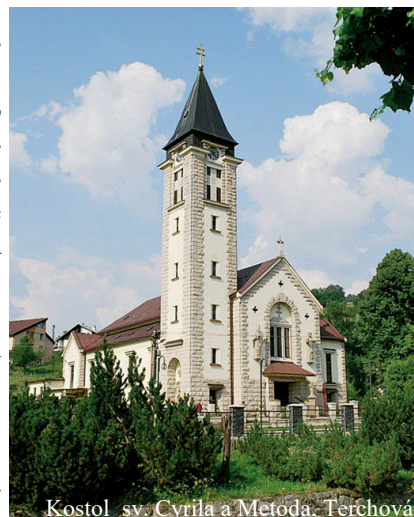
Kostol sv. Cyrila a Metoda, Terchová

Stal sa vyhľadávaným miestom pre návštevníkov okolitého kraja. Každoročne sa tu konajú známe „ Cyriľometodské dni “. Slávnosti trvajú 3 až 4 dni a počas nich sa okrem duchovných akcií, sv. omši, krížovej cesty, vysluhovania sviatosti zmierenia, koná aj viacero sprievodných kultúrnych akcií. Vyvrcholením býva sv. omša na vrchu Oravcové. Vždy 5. júla sa tu koná spoločná diecézna púť. Terchovská farnosť je známa svojimi kultúrnymi