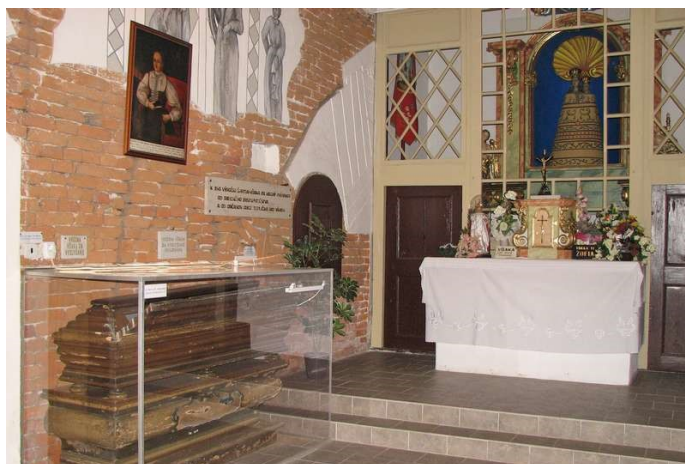
Loretánska kaplnka v Tepličke n. Váhom je známa aj ako Kaplnka Žofie Bosniakovej

V našom putovaní po loretánskych kaplnkách, tentoraz v Žilinskej diecéze, navštívime dve, spojené s výnimočnými ženami. Prvou z nich, ktorá je asi najznámejšou loretánskou kaplnkou na Slovensku, je Loretánska kaplnka v Kostole sv. Martina v Tepličke nad Váhom . Táto obec sa nachádza v tesnom susedstve mesta Žilina v smere na Terchovú. S jej históriou sa spája meno Žofie Bosniakovej , šľachtickej, ktorá zomrela na hrade Strečno 28. 4. 1644. Žofia Bosniaková bola známa pre svoju skromnosť, dobrosrdečnosť, cit pre spravodlivosť a rýdže povahové vlastnosti. Jej životným krédom bolo, že po človekovi ostanú len dobré skutky, všetko ostatné odveje neľútostný čas. Tejto zásade