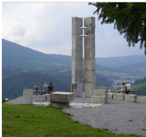
Oravcové, vrch kalvárie

pápeža Jána Pavla II. Pri návšteve Terchovej je vhodné navštíviť vrch Oravcové, kde je oltár s kamennými piliermi, ktoré tvoria dvojramenný kríž. Cestu k nemu lemujú netradičné zastavenia krížovej cesty.