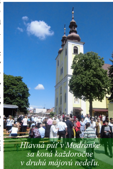
Hlavná púť v Modranke sa koná každoročne v druhú májovú nedeľu.