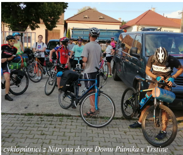
cyklopútnici z Nitry na dvore Domu Pútnika v Trstíne