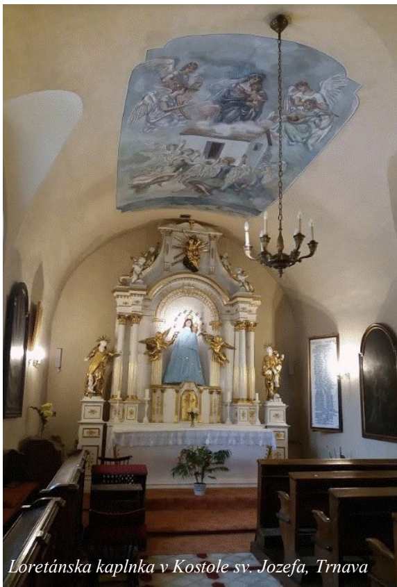
Loretánska kaplnka v Kostole sv. Jozefa, Trnava

Druhá Loretánska kaplnka na území Trnavy sa nachádza v Kostole sv. Jozefa , ktorý v súčasnosti spravujú bratia Pavlíni (OSPPE), ale pôvodne ho (v 1.pol.17.st.) začali budovať reformovaní evanjelici, kalvíni. V rámci protireformačnej politiky mesta ho napokon dostali do správy rehoľníci rádu sv. Pavla prvého pustovníka (r. 1671), ktorí ho nasledujúcom roku, po viacerých stavebných úpravách, zasvätili sv. Jozefovi, pestúnovi Pána. Stavba kostola svojou architektúrou (i slohom) patrí medzi sieňové sliezske protestantské kostoly so štítovým priečelím bez veže. Za veľkého požiaru v r. 1683, počas Tököliovského povstania, bol kostol veľmi poškodený a jeho opravy trvali až do r. 1695. V r. 1701 bola k severnej stene kostola pristavaná kaplnka loretánskej Panny Márie a v 19. st. drevená zvonica s barokovou bāňou. Na hlavnom oltári je obraz sv. Jozefa Pestúna. Na stropě sú štyri oválne kartuše s obrazmi zo života sv. Jozefa. Koncom 18.st. vznikol pri kostole slovenský Spolok sv. ruženca, ktorý od začiatku 19.st. organizoval pre veriacich pešie púte z Trnavy do Marianky. Pavlíni odišli z Trnavy už v r. 1786 pri rušení kláštorov, ktoré nariadil rakúsky cisár Jozef II., späť sa vrátili v júli 1997.