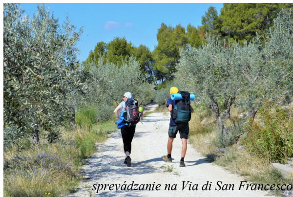
sprevádzanie na Via di San Francesco