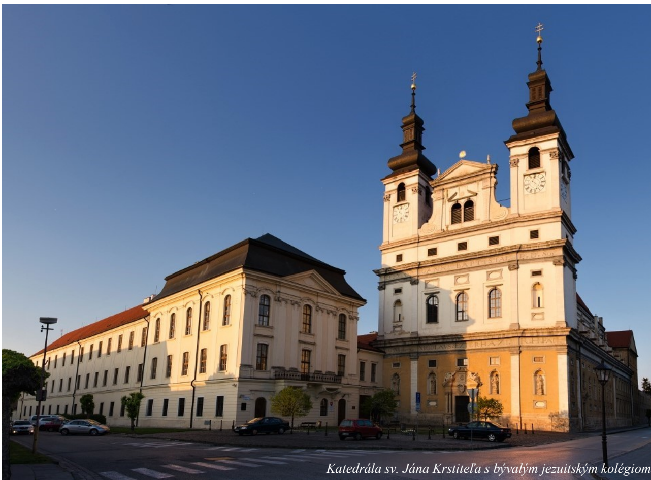
Katedrála sv. Jána Krstiteľa s bývalým jezuitským kolégiom