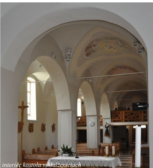
interiér kostola v Malženicach

Pôvodne dvojvežové západné priečelie bolo poškodené a nahradila ho jedna nová veža, ktorú umiestnili v osi trojlodia. Pri rozsiahlej prestavbe v r.1890 postavili vysokú ihlanovú strechu, ktorú v nárožiach doplnili neskorobarokové kamenné sochy svätcov – sv. Floriána, sv. Jána Nepomuckého, sv. Kataríny a sv. Alžbety.