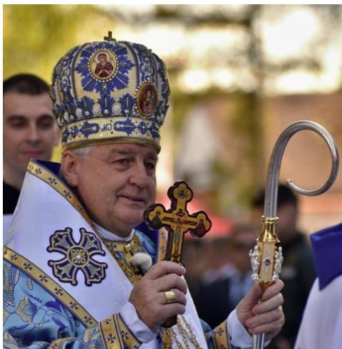
Mons. Ján Babjak SJ, ktorého heslo znie: „Vy ste chrám živého Boha!“ (2Kor6,16)

Územie súčasnej Prešovskej archieparchie bolo súčasťou pôvodnej Mukačevskej gréckokatolíckej eparchie. Samostatne ju vyčlenil a zriadil pápež Pius VII. dňa 21. septembra 1818 bulou Relata Semper . Dňa 30. januára 2008 bola pápežskou bulou Benedikta XVI. Spirituali emolumento povýšená na archieparchiu. Zároveň bola zriadená Prešovská gréckokatolícka metropolia. Sufragánnymi eparchiami sa stali Košická eparchia a Bratislavská eparchia (založená v r. 2008).