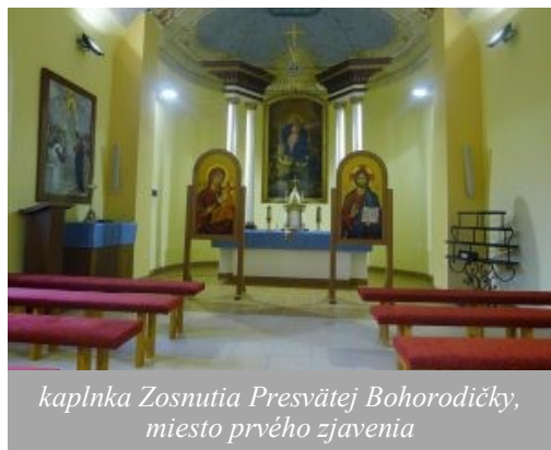
kaplnka Zosnutia Presvätej Bohorodičky, miesto prvého zjavenia

sa k Panne Márii. Po viacerých zjaveniach, ktoré nasledovali na potvrdenie ich dôveryhodnosti, skutočne veriaci postavili na hore kríž a neskôr aj kaplnku. V r. 1855, po prešetrení zázračných udalostí, keď pápež Pius IX. svojim dekrétom ustanovil odpustky, ktoré možno získať na Ľutinskej hore, sa tu uskutočnila prvá oficiálna púť. Pútnici prinášali so sebou aj kamene na stavbu kaplnky (dnes: kaplnka Zosnutia Presvätej Bohorodičky ). Keďže na horu prichádzalo