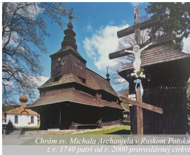
Chrám sv. Michala Archanjela v Ruskom Potoku z r. 1740 patrí od r. 2000 pravoslávnej cirkvi

V niektorých starších stavbách boli zhotovované dodatočne. Ako krytina sa na drevených chrámoch používal zásadne šindel. Pre drevené rusínske chrámy je typická bohatá výzdoba, ktorá sa uplatňovala dokonca aj v spôsobe kladenia šindľov, šalovacích dosák a líšt. Tesársko-rezbárske geometrické ornamente nachádzame na rôznych architektonických detailoch – trámoch, nosných stĺpoch, zárubniach, okenných rámoch a pod. Na mnohých drevených chrámoch sa zachovali rôzne ozdobné kupoly, kuželovité, lichobežníkovité a pyramidálne ukončenia striech. V rôznych dekoratívnych a doplnkových funkčných detailoch sa uplatňoval aj kov (kríže, mreže, kovanie a dvere). Najmä železné kríže sú výrazovým dobovým umeleckým