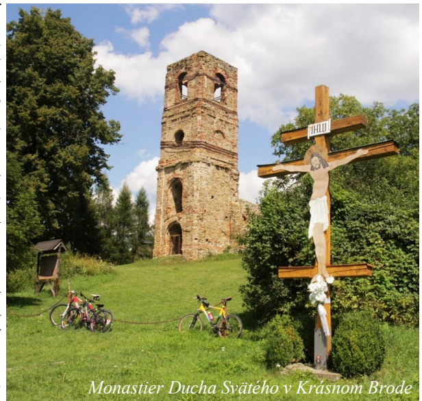
Monastier Ducha Svätého v Krásnom Brode