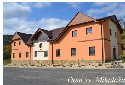
Dom sv. Mikuláša

V okolí baziliky sa nachádza krásny areál, ktorý sa neustále zveľaďuje a dopĺňa o ďalšie objekty. Jeho dominantou je drevený Chrám svätej Rodiny , ktorý sa vyníma na skale nad bazilikou. Ide o kópiu zhorého ľutinského chrámu, ktorého základy sú na námestí pred bazilikou, kde kedysi stál. Veľkým turistickým lákadlom je veža chrámu, ktorá slúži ako vyhliadka na celé okolie. Dôležitým je aj formačný Dom sv. Mikuláša , ktorý poskytuje veriacim celoročné ubytovanie a možnosť konať si skupinové duchovné cvičenia. Na modlitbu v prírode môžu veriaci využívať aj Krížovú cestu, Cestu svetla a ružencové kaplnky v Záhrade Bohorodičky . Sú tu umiestnené aj viaceré výnimočné gréckokatolícke ikony Bohorodičky. Sakrálne bohatstvo širšieho regiónu môžu pútnici spoznať v pôsobivom miniskanzene drevených kostolov.