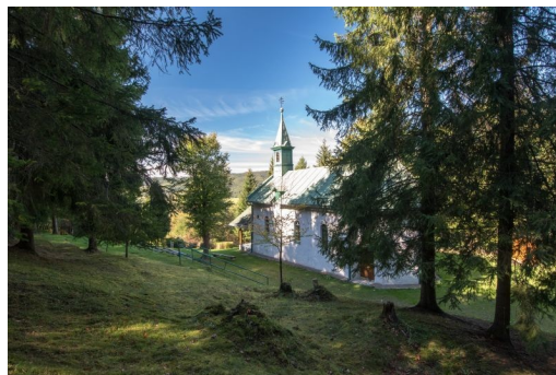
Ludia sem prichádzali a podľa podania tu došlo viacerým zázračným uzdraveniam.