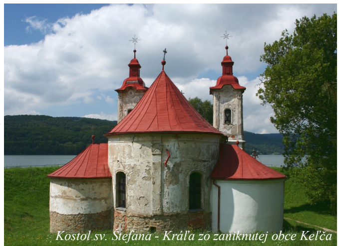
Kostol sv. Štefana - Kráľa zo zaniknutej obce Keľča

Ak pôjdete na bicykloch, odporúčame Vám zájsť aj do Novej Keľče (+10km), kde nájdete starobyľý barokovo-rokokový Kostol sv. Štefana – kráľa , ktorý pri stavbe priehrady, kvôli ochrane pred vodou, obohnali valom, čím vytvorili pôvabný polkruhový polostrov. Bohužiaľ problémy nastali kvôli spodnej vode, a tak sa chrám pre zlý technický stav prestal využívať na náboženské účely. Dnes sa vzácnu kultúrnu pamiatku usiluje zachrániť občianske združenie Stephanus, ktoré ho počas letnej sezóny sprístupňuje verejnosti a v budúcnosti tu plánuje zriadiť múzeum.