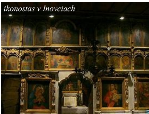
ikonostas v Inovciach

prví apoštoli Peter a Pavol ako symboly jednoty kresťanov. Za nimi môžu byť štyria evanjelisti, po dvoch z každej strany. Potom ostatní apoštoli: Andrej, Jakub Zebedeov, Filip, Bartolomej, Tomáš, Jakub Alfeov, Tadeáš Šimon a Matej. Tento rad poukazuje na genézu, teda proces vzniku Cirkvi. Vo štvrtom, tzv. prorockom rade sú zobrazení starozákonní proroci, teda 4 veľkí a 12 tzv. malí (Mojžiš, Áron, Eliáš, Dávid, Šalamún, Izaiáš, Jeremiáš, Ezechiel, Daniel, Jonáš, Micheáš a ďalší), každý so zvitkom symbolizujúcim proroctvo o Mesiášovi. Uprostred tohto radu sa nachádza ikona Svätej Trojice.