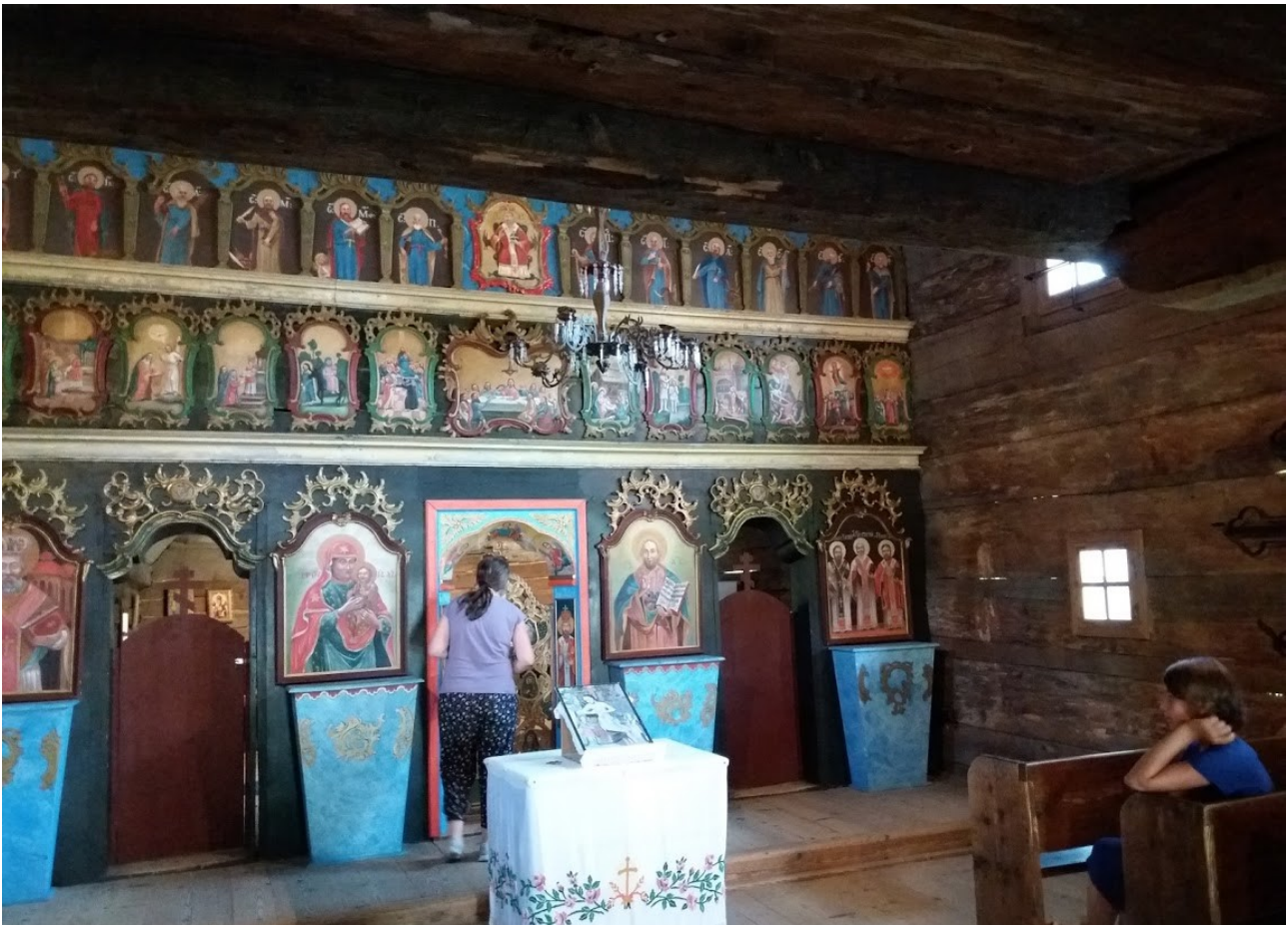
Chrám sv. Mikuláša zo Zboja sa nachádza v Bardejovských kúpeľoch, originál ikonostasu je v Šarišskom múzeu v Bardejove