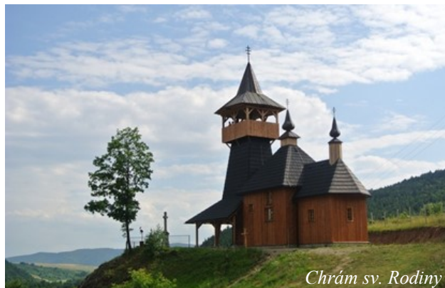
Chrám sv. Rodiny