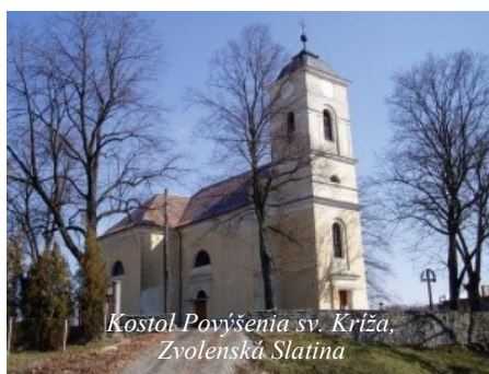
Kostol Povýšenia sv. Kríža, Zvolenská Slatina