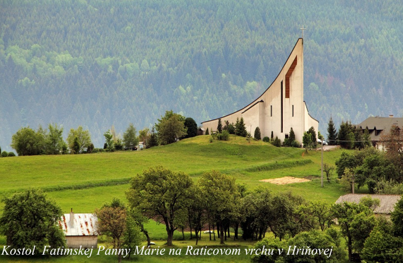
Kostol Fatimskej Panny Márie na Raticovom vrchu v Hriňovej