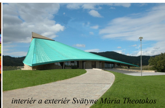
interiér a exteriér Svätyne Mária Theotokos