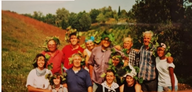
vo viniaciach Loppiana