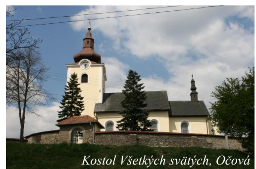
Kostol Všetkých svätých, Očová