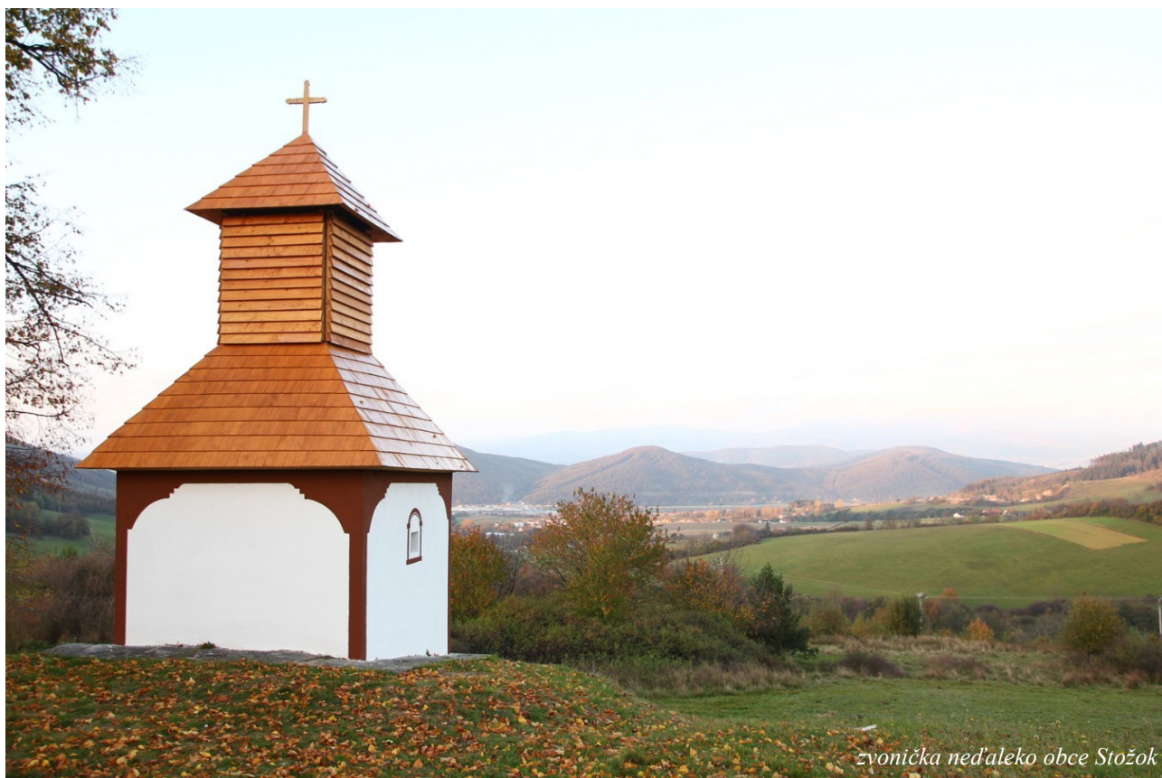
zvonička neďaleko obce Stožok