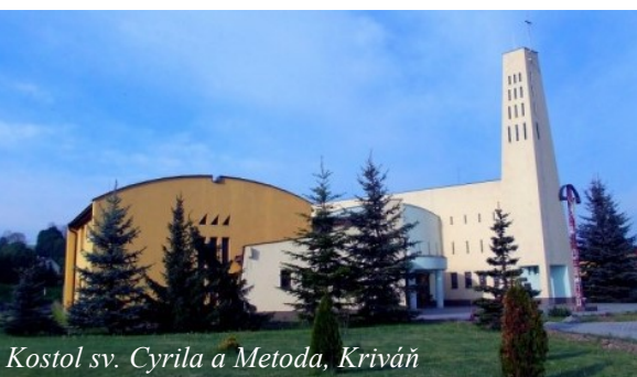
Kostol sv. Cyrila a Metoda, Kriváň