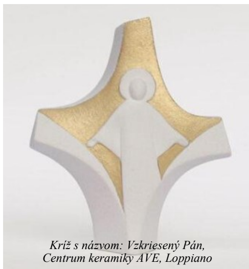
Križ s názvom: Vzkriesený Pán, Centrum keramiky AVE, Loppiano