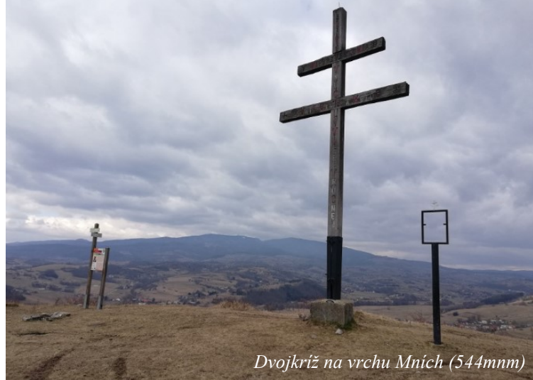
Dvojkríž na vrchu Mních (544mm)