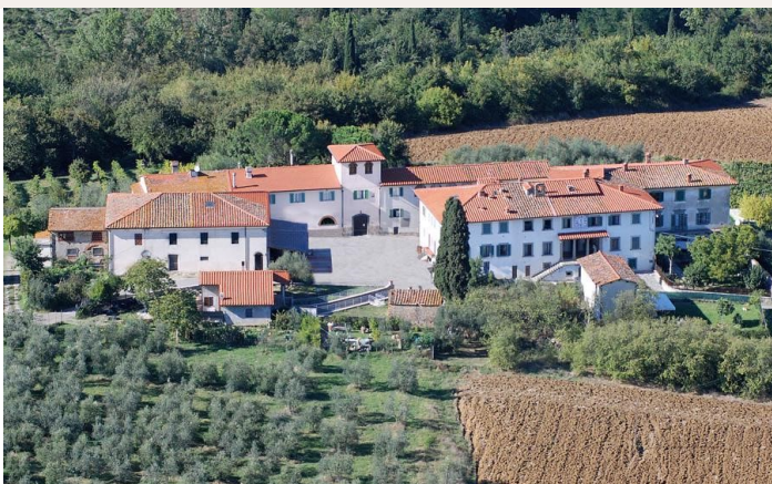
Loppiano, hlavná budova farmy (Cooperativa fattoria), poskytuje aj služby agroturizmu či turistickej ubytovne