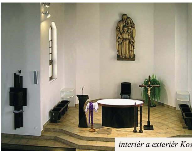
interiér a exteriér Kostola Sv. rodiny v Stožku