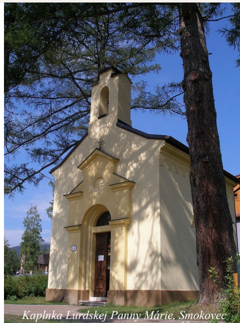
Kaplnka Lurdskej Panny Márie, Smokovec