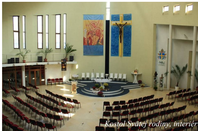
Kostol Svätej rodiny, interiér

sa stali dejiskom návštevy pápeža Jána Pavla II. v r. 2003. Na sv. omši sa tu zúčastnilo okolo 250 tisíc veriacich nielen zo Slovenska, ale aj z okolitých krajín. Pri tejto príležitosti pápež, ešte nie celkom dostavaný kostol aj posvätil. Na počesť tejto udalosti bola plocha, na ktorej kostol stojí, pomenovaná ako Námestie Jána Pavla II. Samotný kostol je modernou stavbou, ktorú tvorí hlavná loď s presbytériom a bočnými loďami so špeciálnymi funkciami, chór pre spevokol a umiestnenie organu, sakristia a zázemie kostola, pastoračné centrum a budova fary.